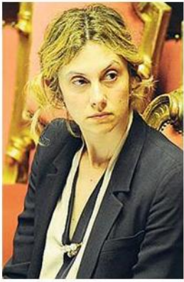
Il ministro della Pa Marianna Madia